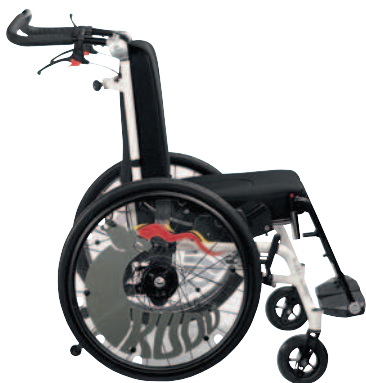
Abbildung zeigt Kudu mit abnehmbaren Fußstützen

Der Kudu ist ein Multifunktions-Rollstuhl für Kinder und Jugendliche, der vielfältige Optionen mit Design kombiniert und so die notwendige Unterstützung und Komfort bietet. Der Kudu ist in 4 Größen erhältlich.