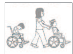
GMFCS Level V