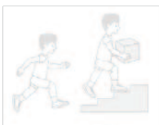
GMFCS Level I