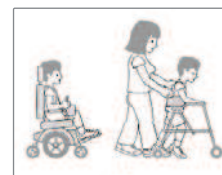
GMFCS Level IV