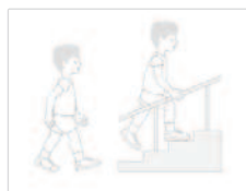
GMFCS Level II