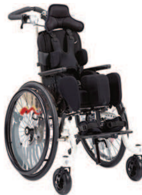
Abbildung zeigt Kudu mit optionalem Zubehör