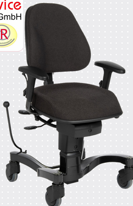
VELA Tango 700E