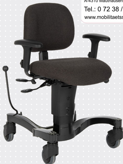
VELA Tango 700